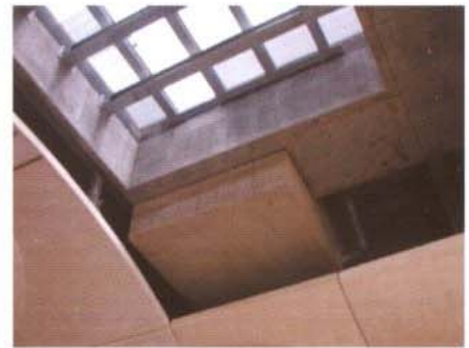
▲ Réserve dans la dalle supérieure pour le module de désenfumage statique

L'étude a été réalisée en analogie hydraulique sur une maquette au 1/15 qui reproduit un élément de