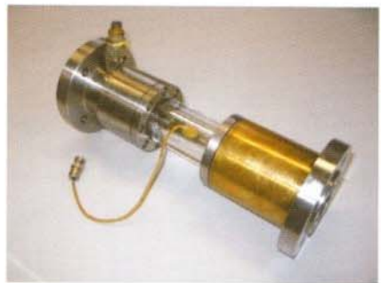
▲ Vue du Venturi

Avant la livraison, le CERG réalise les tests de vérification de performances du V.A.G sur ses propres installations.