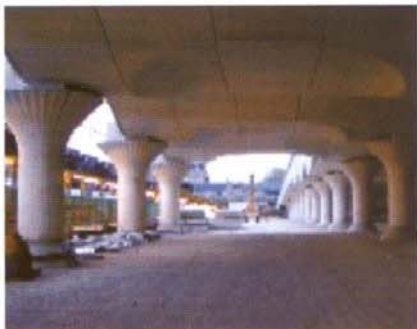
▲ Extension de la couverture

La réalisation de l'extension de la couverture des quais de la gare d'Austerlitz à Paris dans le prolongement de la Bibliothèque de France, par une dalle urbaine aménageable (figure 1), nécessite la mise en place d'un certain nombre d'équipements de désenfumage, qui ont pour mission un bon dégagement des fumées dans la zone de circulation des usagers en cas d'incendie, et une évacuation correcte de ces fumées vers l'extérieur de l'équipement.